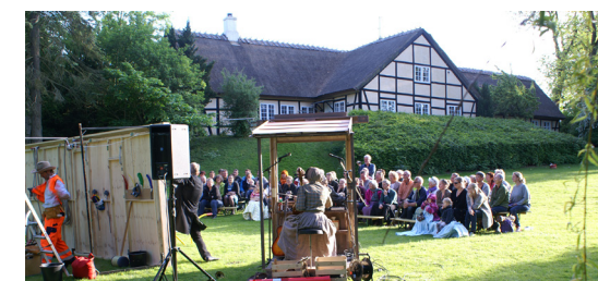
BILLEDER FRA GRUNDLOVDAG I 2015, HVOR DANSK RAKKERPAK OPFØRTE "DEN GODE, DEN ØNDE" OG DEN UFATTELIGT GRIMME"

Om "Lus i skindpelsen" Dansk Rakkerpaks seneste produktion "Lus i skindpelsen", er en teaterforestilling i den komiske boldgade; fortalt i et universelt fysisk teatersprog, der gør den velegnet på tværs af såvel alders- som landegrænser. I den varme sommersonne sidder to venner på en bænk og udveksler drømme. En tredje kommer forbi. Han vil gerne være med i selskabet, - men tre på en bænk er en for mange og han afvises! Han får en ide - han vil sætte lus i skindpelsen. Han vender tilbage i utallige forklædninger for at så splid mellem de to venner. Planen lykkes. En sort sky går for solen. Vennerne begynder at slå hinanden i hovedet med alverdens fornærmelser. Det udvikler sig til en grotesk slapstick krig direkte for øjnene af publikum. Lus i skindpelsen er en forestilling med opbyggelig morale og happy end.