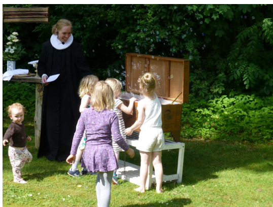
2. PINSEDAG ER OGSÅ EN DAG FOR BØRNENE

Følg med på Søhøjlandets facebookside eller de lokale facebooksider for bl.a. Flueblomsten for mere information om aktiviteter på dagen.