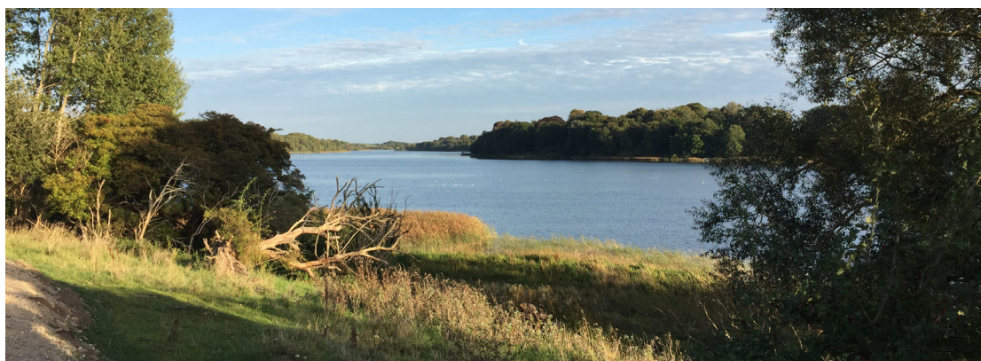
NATURSTIEN GÅR BL.A. LANGS HARALDSTED SØ. 2. PINSEDAG BLIVER VED DET GAMLE TRAKTØRSTED MED UDSIGT UD OVER HARALDSTED SØ